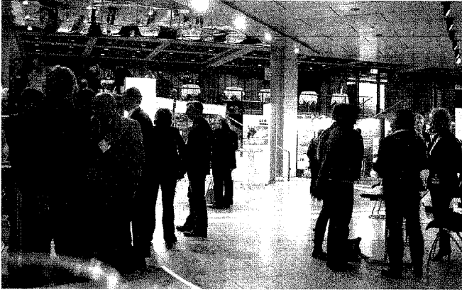
Abbildung 3: Kaffeepausen und Fachausstellung, intensiv genutzte Kommunikationsplattformen

sen. Beengte Standorte, hoch komplexe regionalgeologische Situationen, großflächige Schäden, die Palette der projektkonkreten Herausforderungen ließe sich beliebig fortsetzen. Die intensive Befassung mit diesen Themen zeigt den Bedarf an standortkonkreter Optimierung von Sanierungsmaßnahmen und differenzierter Anforderungen an deren Überwachung und Nachsorge. Es ist immer wieder erstaunlich, welche Lösungen für den Einzelfall gefunden und dann technisch erfolgreich realisiert werden können. PFT, an-