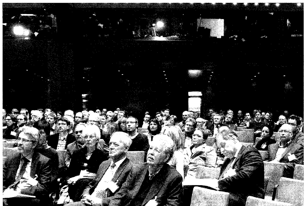
Abbildung 1: Blick in das gut gefüllte Auditorium

auch, dass die vorgenannten Themen aktuell nur in einem breiteren Kontext diskutiert und vorangebracht werden können. Für Themen wie Klimaschutz, Erneuerbare Energien oder Ressourcenmanagement sind Flächennutzung und sukzessive Sanierungskonzepte durchaus interessante Aufhänger für umweltpolitische Erfolgsgeschichten. Aber sichert uns diese „Alibi-funktion“ auf Dauer eine kontinuierliche Akzeptanz im schnelllebigen politischen Geschäft oder sollten wir, stärker noch, Ideen und Innovationen in die Altlastenvermeidung investieren? Ansätze dazu standen insbesondere im thematischen Rampenlicht der Vorabendveranstaltung und des ersten Veranstaltungstages. Es ist sehr zu begrüßen, dass der Verband auch vermeintlich randliche Themen zur Diskussion stellt. Mobilität und Urbanität, wie von Herrn Prof. Fischer (Beiratsvorsitzender des ITVA) auf der Vorabendveranstaltung thematisiert, bieten ein erhebliches ökonomisches Potenzial, die Leistungsfähigkeit von Bund und Ländern zu erhalten, bergen aber gleichzeitig erhebliche soziale Probleme und emotionalen Zündstoff. Eine zunehmend älter werdende Bevölkerung und eingeschränkte Mobilitätsangebote in siedlungsschwächeren Regionen müssen zusammen mit den Betroffenen gelöst werden. Dazu bedarf es neuer Kon-